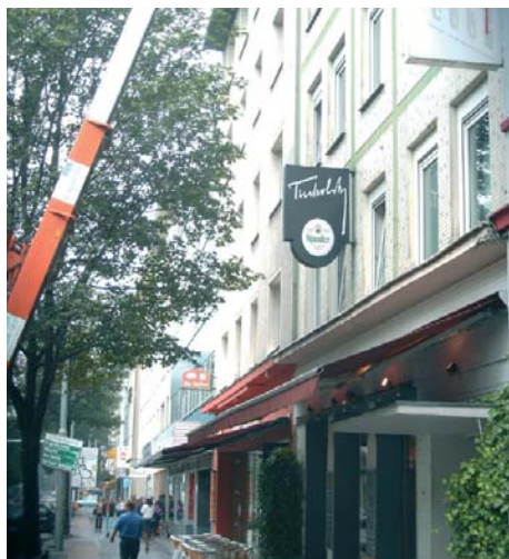
Links: Das „Tucholsky“, mitten im „Bermuda3Eck“, dem Bochumer Ausgehviertel, gelegen. Rechts: Musikalienhandlung in Hamm.

KULTUR FÜR KENNER UND DIE MASSE Ein besonderes Merkmal der Musikwirtschaft im Ruhrgebiet ist die ausdifferenzierte Musikszene: Musik-Kneipen und Clubs mit Lifestyle-Ambiente bieten einen Mix aus Café/Restaurant/Kneipe, Dancefloor, Live-Konzerten, Parties und Unterhaltungsaktionen an. Viele haben kleine Bühnen integriert, auf denen Hip-Hop-, Jazz-, Rock/Pop- oder Weltmusik-Konzerte stattfinden. Neben diesen Kleinstveranstaltungsstellen gibt es die größeren Anbieter wie das „Pulp“ in Duisburg, das mit mehreren Tanzflächen, Disco, Live-Musik etc. oft über 1.000 Besucher/innen anzieht, die „Zeche“ Bochum, der „Delta Music Park“ in Duisburg, der „Musik-Zirkus-Ruhr“ oder die „Turbinehalle“ in Oberhausen. Insgesamt sind im Ruhrgebiet mehr als 150 kleine und mittlere Veranstaltungsorte zu finden. Dazu lassen sich die meisten soziokulturellen Zentren zählen, wie zum Beispiel die „Zeche Carl“ in Essen, die heute weitgehend erwerbswirtschaftlich ausgerichtet sind. Bundesweit bekannt sind auch die sieben großen Veranstaltungshallen und Arenen des Ruhrgebiets, so die traditionsreiche „Westfalenhalle“ in Dortmund und die neu errichtete Veltinsarena „Auf Schalke“ mit bis zu 70.000 Plätzen. Die hier stattfindenden Musik-, Opern-, Tanz- oder Entertainmentaufführungen ziehen breite Besuchergruppen an und leisten einen nicht zu unterschätzenden Beitrag für die Tourismuswirtschaft der Region.