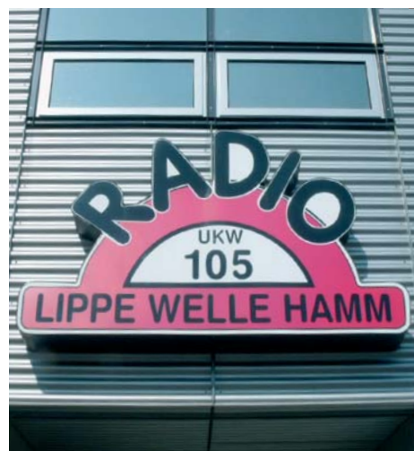
Unten: Das Lokalradio „Lippe Welle“ mit Sitz in Hamm. Rechts: Das Essener „Theater Courage“, Teil der bunten Spielstättenlandschaft des Ruhrgebiets.

EL DORADO FÜR CINEASTEN Das Ruhrgebiet ist nicht zuletzt auch eine „Kinoregion“: 15 Multiplexkinos, aber auch außergewöhnliche Lichtspielhäuser wie die renovierte „Lichtburg“ in Essen, das Kino mit dem größten Saal Deutschlands (1.300 Sitzplätze) sowie eine Reihe kleiner und Kleinst-Kinos (u.a. die „Dorfschenke“ in Duisburg) haben hier ihren Sitz. Bedeutsam für die Filmlandschaft ist auch das seit 1990 bestehende Kinofestival in Lünen, eine Kooperation von der Filmstiftung NRW, der Stadt Lünen und lokalen Sponsoren. Es gilt heute als eines der wichtigsten Kinofeste für deutschsprachige Filmproduktionen.