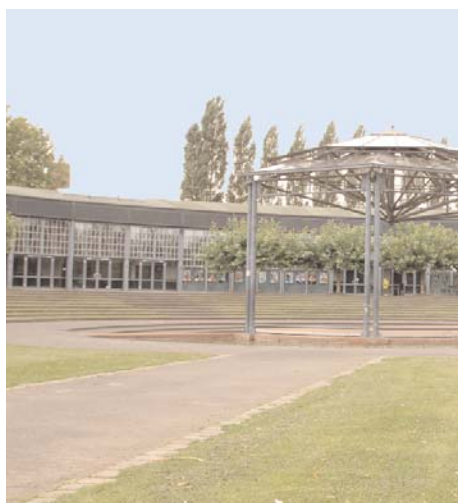
Unten: Der Mülheimer „Ringlokschuppen“, Zentrum für freie Kunst und Kultur. Unten rechts: Das Bochumer Musicalhaus „Starlight Express“.

ZECHER ZOLLVEREIN: WIRTSCHAFTS-, DESIGN- UND KULTURSTANDORT VON RANG In den Bereich der Schlüsselprojekte fällt auch der weitere Ausbau der denkmalgeschützten Zeche Zollverein zu einem Wirtschafts-, Design- und Kulturstandort von europäischem (und sogar internationalem) Rang. Im Jahr 2001 wurde die seit Mitte der 1980er Jahre wieder hergerichtete Gesamtanlage von der UNESCO als „Weltkulturerbe der Menschheit“ unter Schutz gestellt. Das Design Zentrum NRW, ist durch seinen weltweit begehrten Designpreis „red dot award“ international bekannt. Darüber hinaus hat sich „Zollverein“ inzwischen zu einer renommierten Location für Kunstausstellungen, Konzerte, Tanz, Theater und Kongresse entwickelt und zieht jährlich Tausende von Besuchern aus dem In- und Ausland an. Hier,