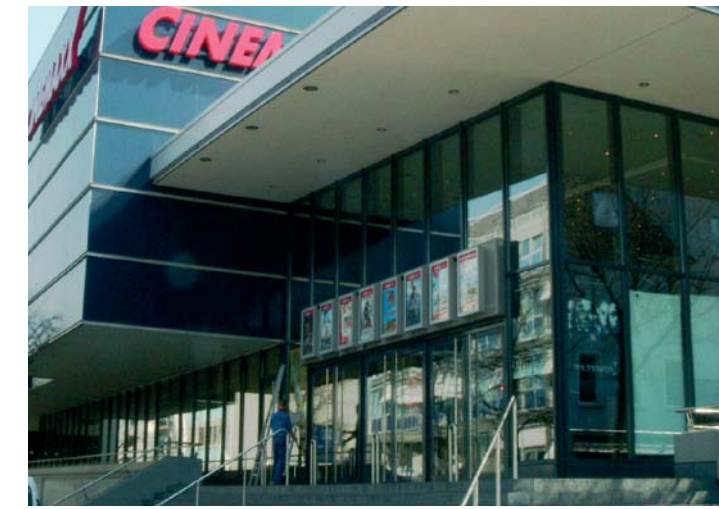
Eines der 15 Multiplexkinos des Ruhrgebiets, das „Cinemaxx“ in Hamm

ren Zechengebäude in Waltrop, ist nicht nur wegen der dort angebotenen Ware einen Besuch wert: Die gut erhaltene bzw. sensibel sanierte Jugendstilarchitektur des Gebäudes bietet dem Auge Industriekultur der Extraklasse. Und schließlich: In der ehemaligen Maschinenhalle „Friedlicher Nachbar“ in Bochum findet seit Jahren die viel beachtete und zunehmend mehr Besucher/innen anziehende Verkaufsmesse für Design, die „Formart“, statt.