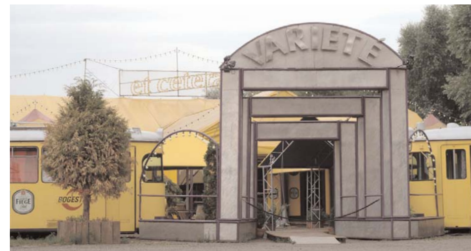
Das „Et Cetera“, eine kleine Varietétheater mit Sitz in Bochum

auf dem ehemaligen Montangelände, entstanden bis heute etwa 900 neue Arbeitsplätze, weitere sollen hinzukommen.