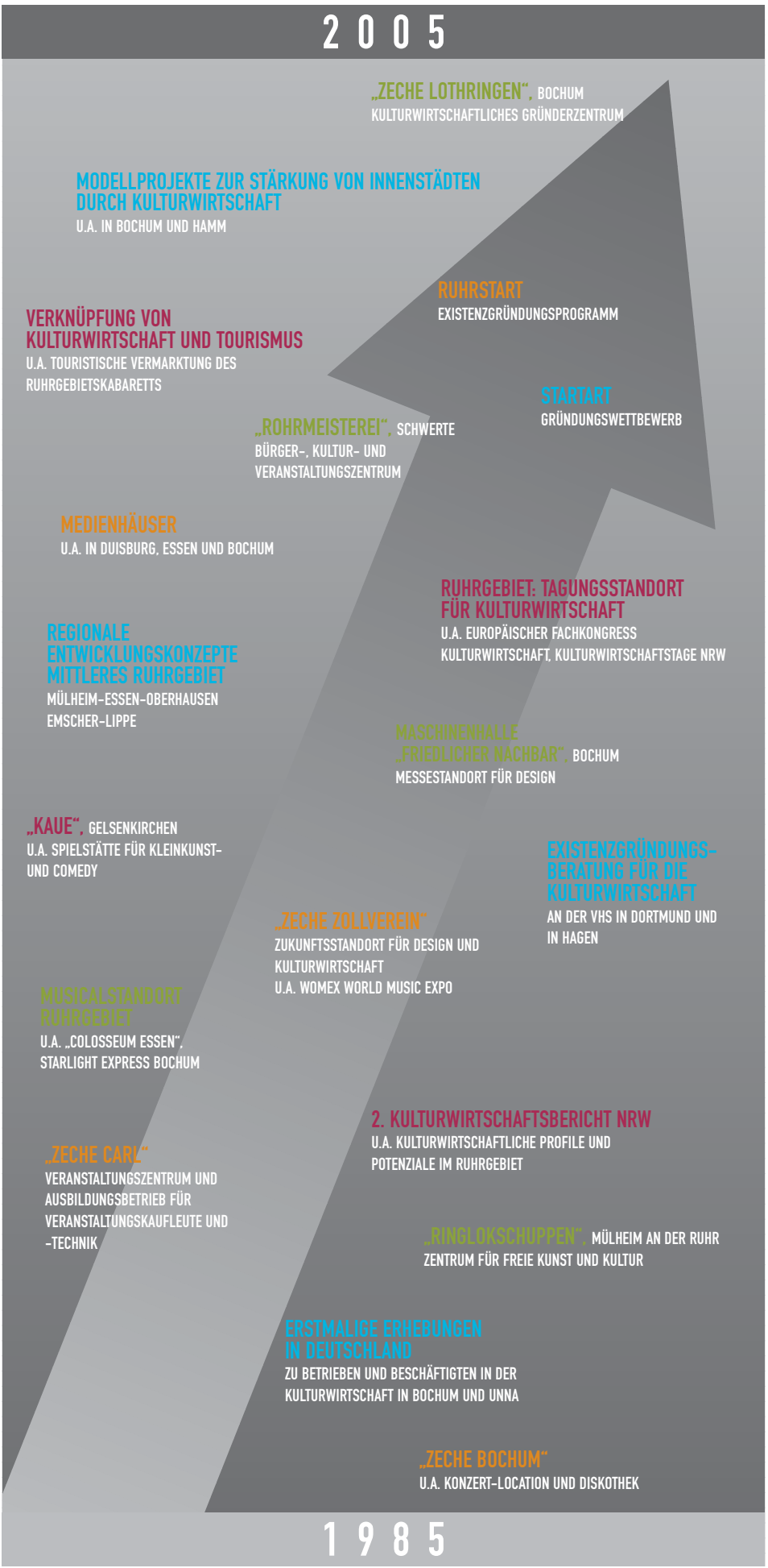
20 Jahre Kulturwirtschaft im Überblick: Die Auswahl an Initiativen, Projekten, Programmen, Studien, Programmen und Veranstaltungen belegt die Vielfalt und Effizienz der gemeinsamen Anstrengungen aller Akteure in Nordrhein-Westfalen.

Abgesehen von der touristischen Bedeutung schaffen die Musicalhäuser eine beachtliche Anzahl an Arbeitsplätzen im anhängenden Dienstleistungssektor (für „Starlight Express“ geht man von etwa 400 Arbeitsplätzen aus), in der Kulturbauwirtschaft und in anderen Branchen. So werden beispielsweise die „Stopper“ für die von den Darstellern getragenen Rollschuhe von einem ehemaligen Bergbauzulieferer in Hattingen produziert. Die Musicalhäuser tragen so zur Diversifizierung des regionalen Wirtschafts- und Arbeitsmarktes bei, beeinflussen die Produkt- und Dienstleistungspalette anderer Unternehmen und Branchen und erweitern den Arbeitsmarkt für theaterspezifische Berufe.