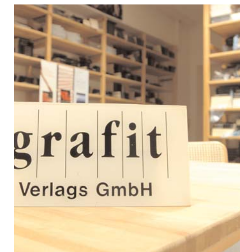
Links: Die Essener Heine-Buchhandlung. Hier decken die Studenten der nahe gelegenen Universität Essen-Duisburg ihren Bedarf. Rechts: Der Sitz des Dortmunder grafit-Verlags.

LITERATUR- BUCH- UND PRESSEMARKT Von zentraler arbeitsmarktpolitischer und wirtschaftlicher Bedeutung für das Ruhrgebiet ist der Literatur-, Buch und Pressemarkt; hier findet sich eine breite Palette an Groß- und Kleinstbetrieben, darunter Autor/innen, Verlage, der Buchhandel und die Betriebe des Pressemarktes sowie des Druckgewerbes. Trotz nennenswerter Arbeitsplatzverluste in der Druckbranche sowie im Bereich Satz bzw. Medienvorstufe gibt dieser Teilmarkt der Kulturwirtschaft auch heute noch 18.500 sozialversicherungspflichtig Beschäftigten ein Auskommen; das entspricht für das Jahr 2003 fast der Hälfte aller Beschäftigten der Kulturwirtschaft in der Region. Die herausragende Bedeutung dieses Teilmarkts für den regionalen Arbeitsmarkt korreliert mit den hier erzielten Umsätzen: So erwirtschafteten die rund 1.700 Betriebe und Selbstständigen im Jahr 2003 einen Umsatz von ca. 3,9 Mrd. EUR und damit etwas mehr als die Hälfte aller Umsätze der Kulturwirtschaft der Region.